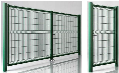
D Słupy - przęsła H=320 profil 60x40x1,2 mm - brama H=250 cm profil 60x60x2 mm - furtka H=230 cm profil 60x40x2 mm